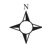
PŘÍLOHA 1 - TECHNICKÁ INFRASTRUKTURA - VODNÍ HOSPODÁŘSTVÍ schema Zvoleněves - M 1:10000

zásobovací řad veřejného vodovodu vodovodní řady stoky splaškové oddílné kanalizace čerpací stanice odpadních vod čistírna odpadních vod zatrubněný vodní tok aktivní zóna záplavového území Knovízského potoka hranice Q100 záplavového území Knovízského potoka